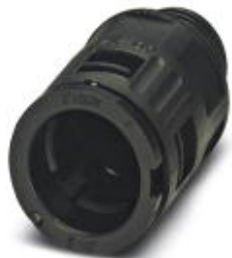
Dławnik kablowy, gwint metryczny, klasa ochrony IP66, prosty

Należy pamiętać, że podane dane pochodzą z katalogu online. Proszę o pobranie kompletnych informacji i danych z dokumentacji użytkownika. Obowiązują ogólne warunki użytkowania dla materiałów pobieranych przez Internet. ( http://phoenixcontact.pl/download )