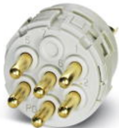
Wkładka stykowa, liczba biegunów: 17, Rodzaj styku: Styk męski, Przyłącze lutowane

Należy pamiętać, że podane dane pochodzą z katalogu online. Proszę o pobranie kompletnych informacji i danych z dokumentacji użytkownika. Obowiązują ogólne warunki użytkowania dla materiałów pobieranych przez Internet. ( http://phoenixcontact.pl/download )