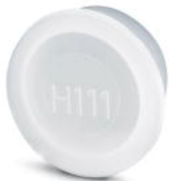
Kołpak ochrony przeciwpyłowej z tworzywa sztucznego dla złączy wtykowych z nakrętką radełkową M23

Należy pamiętać, że podane dane pochodzą z katalogu online. Proszę o pobranie kompletnych informacji i danych z dokumentacji użytkownika. Obowiązują ogólne warunki użytkowania dla materiałów pobieranych przez Internet. ( http://phoenixcontact.pl/download )