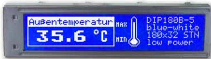
EA DIP180B-5NLW Abmessungen 102 x 27 mm