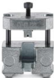
Matryca, do nieekranowanych wtyków RJ45

Należy pamiętać, że podane dane pochodzą z katalogu online. Proszę o pobranie kompletnych informacji i danych z dokumentacji użytkownika. Obowiązują ogólne warunki użytkowania dla materiałów pobieranych przez Internet. ( http://phoenixcontact.pl/download )