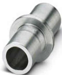
Adapter aluminiowy, do mocowania pisaka P-PEN w ploterze

Należy pamiętać, że podane dane pochodzą z katalogu online. Proszę o pobranie kompletnych informacji i danych z dokumentacji użytkownika. Obowiązują ogólne warunki użytkowania dla materiałów pobieranych przez Internet. ( http://phoenixcontact.pl/download )