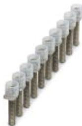
Mostek, Wymiar rastra: 8 mm, Liczba biegunów: 10, Kolor: srebrny

Należy pamiętać, że podane dane pochodzą z katalogu online. Proszę o pobranie kompletnych informacji i danych z dokumentacji użytkownika. Obowiązują ogólne warunki użytkowania dla materiałów pobieranych przez Internet. ( http://phoenixcontact.pl/download )