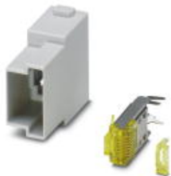
Moduł wkładki stykowej, Liczba biegunów: RJ45, Rodzaj styku: Styk męski, Zastosowanie: Dane

Należy pamiętać, że podane dane pochodzą z katalogu online. Proszę o pobranie kompletnych informacji i danych z dokumentacji użytkownika. Obowiązują ogólne warunki użytkowania dla materiałów pobieranych przez Internet. ( http://phoenixcontact.pl/download )