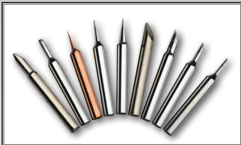
Ersatzspitzen - Serie 1100