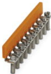
Mostek stały, Wymiar rastra: 8,2 mm, Liczba biegunów: 10, Kolor: srebrny

Należy pamiętać, że podane dane pochodzą z katalogu online. Proszę o pobranie kompletnych informacji i danych z dokumentacji użytkownika. Obowiązują ogólne warunki użytkowania dla materiałów pobieranych przez Internet. ( http://phoenixcontact.pl/download )