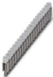
Mostek stały, Wymiar rastra: 6 mm, Liczba biegunów: 100, Kolor: srebrny

Należy pamiętać, że podane dane pochodzą z katalogu online. Proszę o pobranie kompletnych informacji i danych z dokumentacji użytkownika. Obowiązują ogólne warunki użytkowania dla materiałów pobieranych przez Internet. ( http://phoenixcontact.pl/download )