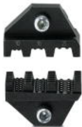
Matryca do automatu zaciskowego CF 500, do końcówek kabli (A... i AI...) 10,16 i 25 mm 2

Należy pamiętać, że podane dane pochodzą z katalogu online. Proszę o pobranie kompletnych informacji i danych z dokumentacji użytkownika. Obowiązują ogólne warunki użytkowania dla materiałów pobieranych przez Internet. ( http://phoenixcontact.pl/download )