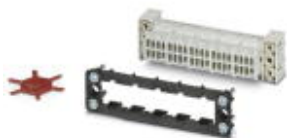
Rysunek przedstawia wersję 40-biegunową

Zestaw wkładek stykowych do strony nabudowanej, rama tulejowa z PE, 4 wkręty mocujące, 8-polowe wkładki stykowe montowane fabrycznie, 6 profili kodujących, 2 kołnierze nabudowane