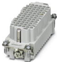
Wkładka styków żeńskich HEAVYCON, seria DD72, 72-pinowa, złącze zaciskane

Należy pamiętać, że podane dane pochodzą z katalogu online. Proszę o pobranie kompletnych informacji i danych z dokumentacji użytkownika. Obowiązują ogólne warunki użytkowania dla materiałów pobieranych przez Internet. ( http://phoenixcontact.pl/download )