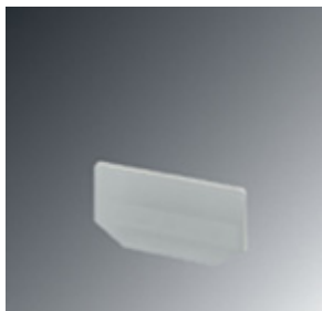
Pokrywa zamykająca, Długość: 68 mm, Szerokość: 2,2 mm, Wysokość: 34 mm, Kolor: szary

Należy pamiętać, że podane dane pochodzą z katalogu online. Proszę o pobranie kompletnych informacji i danych z dokumentacji użytkownika. Obowiązują ogólne warunki użytkowania dla materiałów pobieranych przez Internet. ( http://phoenixcontact.pl/download )