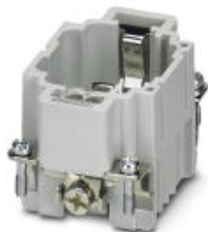
Wkładka styków męskich HEAVYCON, seria DD24, 24-pinowa, złącze zaciskane

Należy pamiętać, że podane dane pochodzą z katalogu online. Proszę o pobranie kompletnych informacji i danych z dokumentacji użytkownika. Obowiązują ogólne warunki użytkowania dla materiałów pobieranych przez Internet. ( http://phoenixcontact.pl/download )