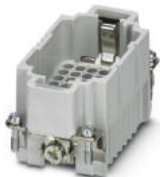
Wkładka styków męskich HEAVYCON, seria DD42, 42-pinowa, złącze zaciskane

Należy pamiętać, że podane dane pochodzą z katalogu online. Proszę o pobranie kompletnych informacji i danych z dokumentacji użytkownika. Obowiązują ogólne warunki użytkowania dla materiałów pobieranych przez Internet. ( http://phoenixcontact.pl/download )