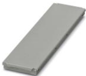
Obud. instalacyjne do zabud., Pokrywa obudowy, Kolor: jasnoszary, Szerokość: 161,6 mm

Należy pamiętać, że podane dane pochodzą z katalogu online. Proszę o pobranie kompletnych informacji i danych z dokumentacji użytkownika. Obowiązują ogólne warunki użytkowania dla materiałów pobieranych przez Internet. ( http://phoenixcontact.pl/download )