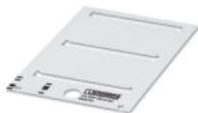
Rys. przedst. wersję artykułu

Szyldzik zapadkowy, Karta, biały, nieopisane, opisywany przy pomocy: THERMOMARK PRIME, THERMOMARK CARD, Rodzaj montażu: zatrzaskiwać na uchwyty tabliczek, Wielkość pola opisowego: 44 x 7 mm