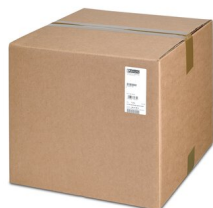
Oryginalne opakowanie do transportu

https://www.phoenixcontact.com/pl/produkty/0801804