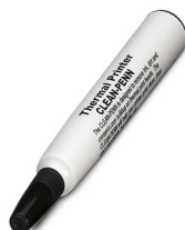
Pręt czyszczący, do drukarek termotransferowych

https://www.phoenixcontact.com/pl/produkty/5145371