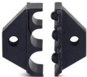
Matryca zapasowa do CRIMPFOX-RC 25

Należy pamiętać, że podane dane pochodzą z katalogu online. Proszę o pobranie kompletnych informacji i danych z dokumentacji użytkownika. Obowiązują ogólne warunki użytkowania dla materiałów pobieranych przez Internet. ( http://phoenixcontact.pl/download )