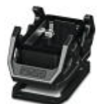
Profile do HEAVYCON EVO z tworzywa sztucznego, B10, z uchwytem poprzecznym, wysokość 30,5 mm, z uszczelką płaską