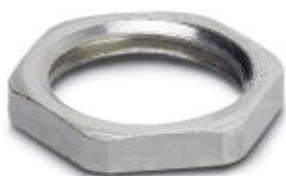
nakrętka płaska z gwintem M16

Należy pamiętać, że podane dane pochodzą z katalogu online. Proszę o pobranie kompletnych informacji i danych z dokumentacji użytkownika. Obowiązują ogólne warunki użytkowania dla materiałów pobieranych przez Internet. ( http://phoenixcontact.pl/download )