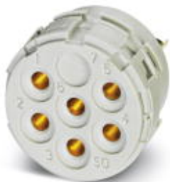
Wkładka stykowa, liczba biegunów: 12, Rodzaj styku: Gniazdo, Przyłącze lutowane

Należy pamiętać, że podane dane pochodzą z katalogu online. Proszę o pobranie kompletnych informacji i danych z dokumentacji użytkownika. Obowiązują ogólne warunki użytkowania dla materiałów pobieranych przez Internet. ( http://phoenixcontact.pl/download )