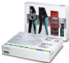
Zestaw do zdejm. izol., zaciskania i wkręcania, wyposażony

Należy pamiętać, że podane dane pochodzą z katalogu online. Proszę o pobranie kompletnych informacji i danych z dokumentacji użytkownika. Obowiązują ogólne warunki użytkowania dla materiałów pobieranych przez Internet. ( http://phoenixcontact.pl/download )