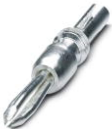
Wtyczki probiercze, z przyłączem lutowanym do 1 mm 2 przekroju przewodu, Kolor: srebrny

Należy pamiętać, że podane dane pochodzą z katalogu online. Proszę o pobranie kompletnych informacji i danych z dokumentacji użytkownika. Obowiązują ogólne warunki użytkowania dla materiałów pobieranych przez Internet. ( http://phoenixcontact.pl/download )