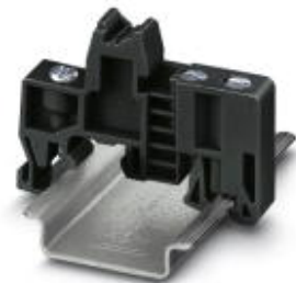
Uchwyt końcowy, do montażu na szynie nośnej NS 32 lub NS 35/7,5

Należy pamiętać, że podane dane pochodzą z katalogu online. Proszę o pobranie kompletnych informacji i danych z dokumentacji użytkownika. Obowiązują ogólne warunki użytkowania dla materiałów pobieranych przez Internet. ( http://phoenixcontact.pl/download )