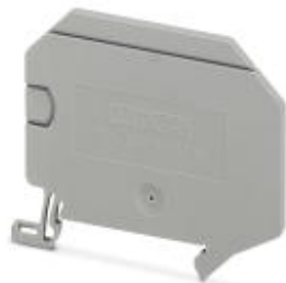
Przegroda rozdzielająca sekcje, długość: 62,1 mm, szerokość: 2,2 mm, wysokość: 52,5 mm, kolor: szary

Należy pamiętać, że podane dane pochodzą z katalogu online. Proszę o pobranie kompletnych informacji i danych z dokumentacji użytkownika. Obowiązują ogólne warunki użytkowania dla materiałów pobieranych przez Internet. ( http://phoenixcontact.pl/download )