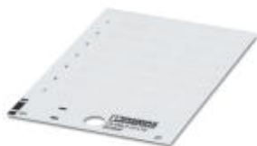
Rysunek przedstawia wariant produktu

Szyld z tworzywa sztucznego, Karta, biały, nieopisane, opisywany przy pomocy: THERMOMARK PRIME, THERMOMARK CARD, Rodzaj montażu: Klejenie, Wielkość pola opisowego: 49 × 15 mm