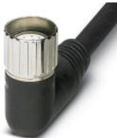
Gniazdo M23, kątowe, 12-biegunowe, z przewodem zbiorczym 5 m, piny 9 i 10 zmostkowane

Należy pamiętać, że podane dane pochodzą z katalogu online. Proszę o pobranie kompletnych informacji i danych z dokumentacji użytkownika. Obowiązują ogólne warunki użytkowania dla materiałów pobieranych przez Internet. ( http://phoenixcontact.pl/download )