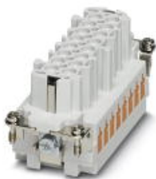
Wkładka styków żeńskich HEAVYCON serii B16, 16-polowa, złącze QUICKON

Należy pamiętać, że podane dane pochodzą z katalogu online. Proszę o pobranie kompletnych informacji i danych z dokumentacji użytkownika. Obowiązują ogólne warunki użytkowania dla materiałów pobieranych przez Internet. ( http://phoenixcontact.pl/download )