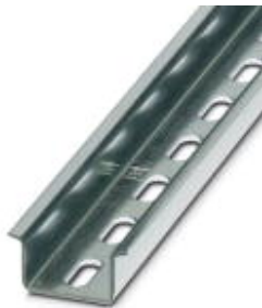
Szyna montażowa NS 35

Należy pamiętać, że podane dane pochodzą z katalogu online. Proszę o pobranie kompletnych informacji i danych z dokumentacji użytkownika. Obowiązują ogólne warunki użytkowania dla materiałów pobieranych przez Internet. ( http://phoenixcontact.pl/download )