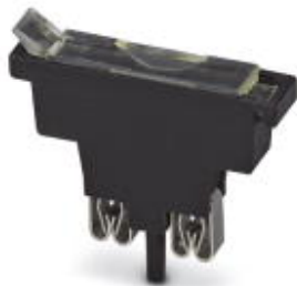
Wtyk bezpiecznikowy, Prąd znamionowy: 6,3 A, Długość: 45,4 mm, Szerokość: 9,9 mm, Kolor: czarny

Należy pamiętać, że podane dane pochodzą z katalogu online. Proszę o pobranie kompletnych informacji i danych z dokumentacji użytkownika. Obowiązują ogólne warunki użytkowania dla materiałów pobieranych przez Internet. ( http://phoenixcontact.pl/download )