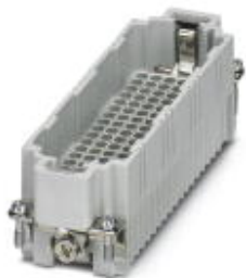
Wkładka styków męskich HEAVYCON, seria DD108, 108-pinowa, nadruk 109 ... 216, złącze zaciskane

Należy pamiętać, że podane dane pochodzą z katalogu online. Proszę o pobranie kompletnych informacji i danych z dokumentacji użytkownika. Obowiązują ogólne warunki użytkowania dla materiałów pobieranych przez Internet. ( http://phoenixcontact.pl/download )