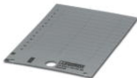
Rys. przedst. wersję artykułu

Szyld z tworzywa sztucznego, Karta, srebrny, nieopisane, opisywany przy pomocy: THERMOMARK PRIME, THERMOMARK CARD, Rodzaj montażu: Klejenie, Wielkość pola opisowego: 27 x 18 mm