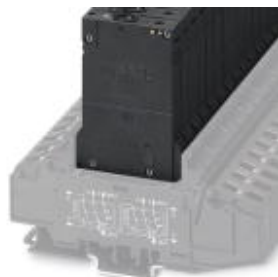
Termomagnetyczny wyłącznik automatyczny, 1-biegunowy, zwłoczny, 1 zestyk zwierny i 1 zestyk rozwierny

Należy pamiętać, że podane dane pochodzą z katalogu online. Proszę o pobranie kompletnych informacji i danych z dokumentacji użytkownika. Obowiązują ogólne warunki użytkowania dla materiałów pobieranych przez Internet. ( http://phoenixcontact.pl/download )