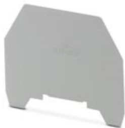
Przegroda, Długość: 61 mm, Szerokość: 0,8 mm, Kolor: szary

Należy pamiętać, że podane dane pochodzą z katalogu online. Proszę o pobranie kompletnych informacji i danych z dokumentacji użytkownika. Obowiązują ogólne warunki użytkowania dla materiałów pobieranych przez Internet. ( http://phoenixcontact.pl/download )