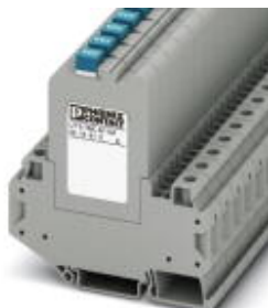
Termomagnetyczny wyłącznik zabezpieczający, 1-biegunowy, do montażu szyny nośnej

Należy pamiętać, że podane dane pochodzą z katalogu online. Proszę o pobranie kompletnych informacji i danych z dokumentacji użytkownika. Obowiązują ogólne warunki użytkowania dla materiałów pobieranych przez Internet. ( http://phoenixcontact.pl/download )