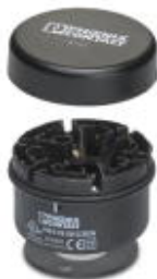
Element przyłączeniowy ze złączami śrubowymi do montażu podłogowego

Należy pamiętać, że podane dane pochodzą z katalogu online. Proszę o pobranie kompletnych informacji i danych z dokumentacji użytkownika. Obowiązują ogólne warunki użytkowania dla materiałów pobieranych przez Internet. ( http://phoenixcontact.pl/download )