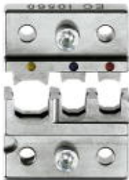
Matryca do automatu zaciskowego CF 500, do styków solarnych, 2,5 mm 2 , 4 mm 2 , 6 mm 2

Należy pamiętać, że podane dane pochodzą z katalogu online. Proszę o pobranie kompletnych informacji i danych z dokumentacji użytkownika. Obowiązują ogólne warunki użytkowania dla materiałów pobieranych przez Internet. ( http://phoenixcontact.pl/download )