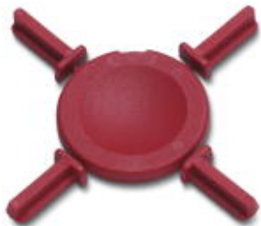
Gwiazda kodująca, Długość: 3 mm, Szerokość: 3 mm, Wysokość: 6 mm, Kolor: czerwone

Należy pamiętać, że podane dane pochodzą z katalogu online. Proszę o pobranie kompletnych informacji i danych z dokumentacji użytkownika. Obowiązują ogólne warunki użytkowania dla materiałów pobieranych przez Internet. ( http://phoenixcontact.pl/download )