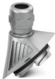
Metalowy przepust kablowy EVO z zamknięciem bagietowym, seria B, rozmiar M20, średnica przewodu 7–13 mm

Należy pamiętać, że podane dane pochodzą z katalogu online. Proszę o pobranie kompletnych informacji i danych z dokumentacji użytkownika. Obowiązują ogólne warunki użytkowania dla materiałów pobieranych przez Internet. ( http://phoenixcontact.pl/download )